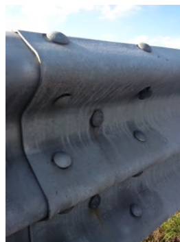
Figura 3 – Esempi di non integrità dei dispositivi di sicurezza

Con riferimento ai supporti (cordoli in c.a. per le barriere bordo ponte o il terreno per le barriere infisse), si evidenzia come la perdita di efficienza del supporto possa essere riscontrata sia direttamente che indirettamente (ad esempio, l'assenza di verticalità o la riduzione di quota delle barriere infisse può essere dovuta alla presenza di cedimenti delle banchine o dei terreni poco compattati). Dovranno quindi essere valutate, tra le altre, le seguenti possibili anomalie: