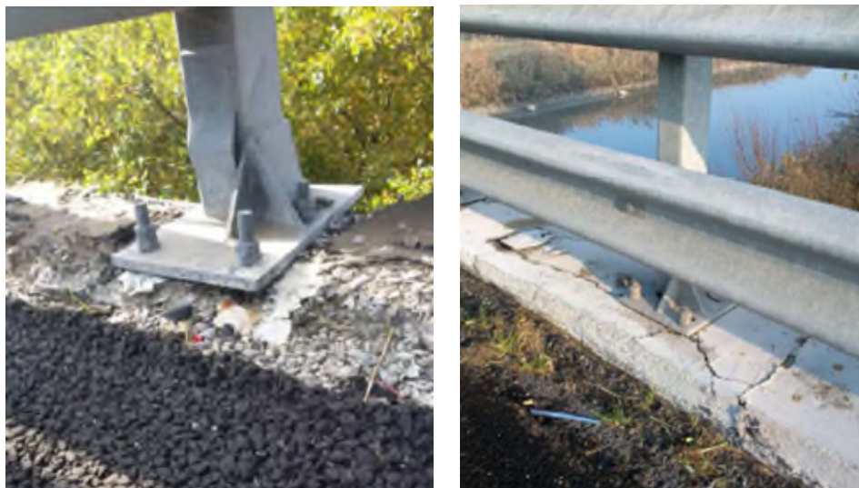
Figura 4 – Esempi di non integrità dei supporti delle barriere di sicurezza.

La constatazione di disallineamenti localizzati attiva un approfondimento immediato attraverso verifica puntuale, secondo le modalità riportate nel paragrafo 3.3.